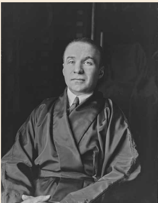
Francis de Miomandre