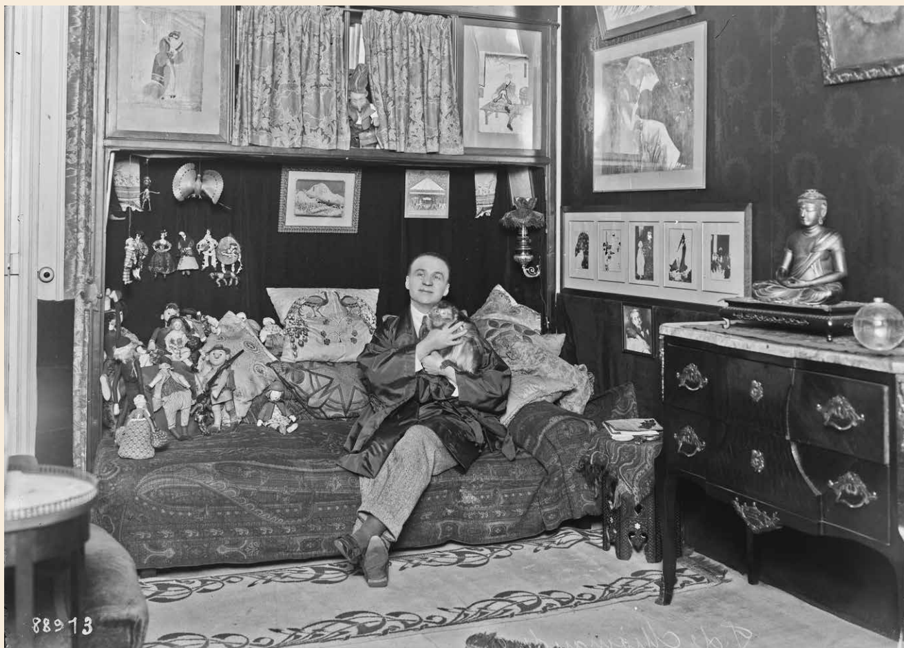
Francis de Miomandre

Poète, romancier, nouvelliste, essayiste, chroniqueur, traducteur, Francis de Miomandre (1880-1959) laisse à sa mort une production abondante, multiple, que l'on a trop tendance à réduire à un titre – Écrit sur de l'eau , prix Goncourt 1908 – et à une forme d'aimable fantaisie. C'est méconnaître tout un pan secret de son œuvre de fiction – des livres plus tardifs, plutôt marqués du sceau du merveilleux et de l'onirisme où Miomandre, à l'instar parfois de son ami Jean Cassou, flirte avec le surréalisme.