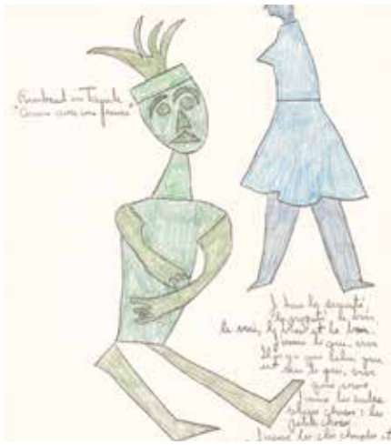
Rimbaud en Tauride. Comme avec une femme... p. 68

Pas de programme certes, avant tout du plaisir pris à un jeu mais une orientation manifeste : subvertir la tradition culturelle en ce qu'elle impose de cohérence, de logique, de tradition éprouvée, de rationnel et de sérieux. Ce livre nous met en présence d'une double genèse dans le scriptural et le pictural. Bien éloignée cependant d'un Roland Giguère pratiquant de concert la poésie et la gravure avec une égale maîtrise et une même passion. Nous sommes ici dans un tout autre registre. Ducharme prêche par l'exemple, et seulement par l'exemple : nous recevons un legs culturel et nous en