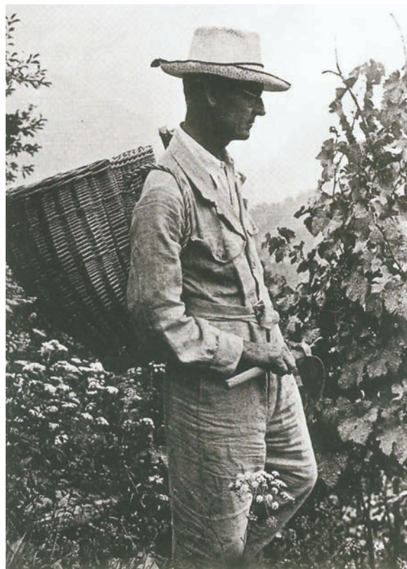
Hermann Hesse, dans le jardin de la casa Bodmer

grands romans et de nouvelles. Mais toute sa vie il a écrit de la poésie. S'y ajoutent d'innombrables comptes rendus, articles de journaux et une très riche correspondance avec sa famille, ses épouses successives, ses deux fils, ses amis, éditeurs, confrères dont Max Brod, Thomas Mann, André Gide – qui l'admirait et préfaça Le voyage en Orient . Écrire était pour lui la vocation impérieuse, il ne s'y est jamais dérobé, il lui a tout sacrifié.