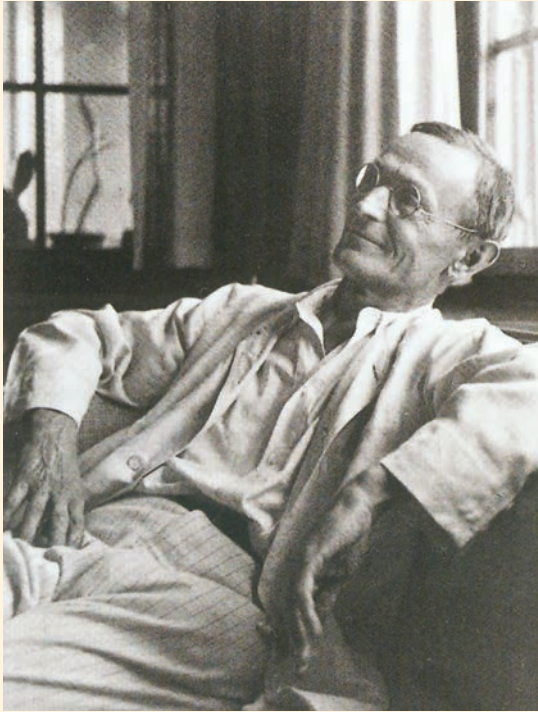
Hermann Hesse, en 1935

Je vais me remettre à l'ouvrage, déclara Klingsor, et dès demain... mon thème ce sera le monde en devenir, en mutation perpétuelle, le monde où toute créature aspire ardemment à devenir homme ou étoile, à travers les naissances et les décompositions successives qui attestent l'universelle présence de Dieu et de la mort.