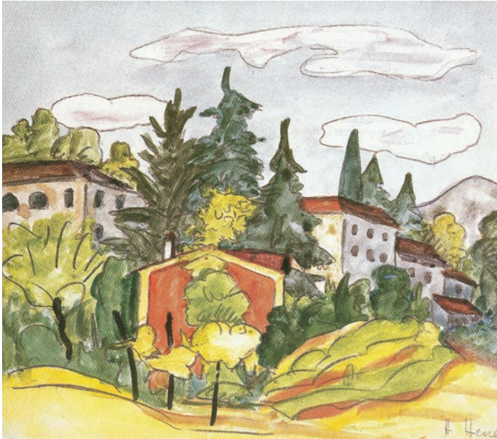
Aquarelle de Hermann Hesse, datée du 21 juin 1927

Goldmund (Bouche d'or) devra, lui, courir ce monde, exposé à ses séductions et à ses dangers pour que, au terme de son errance, il devienne un artiste véritable. La transformation, le choix même du parcours, n'est pas affaire de seule volonté consciente. Des rencontres inopinées viennent éclairer des impulsions intimes quand le sujet est prêt et le pousser à l'action. Se produit alors un bouleversement, une rupture, la sortie des vieilles peaux, le passage à un niveau supérieur de l'être. Siddharta fuit son confort princier, Josef Knecht renonce à sa prestigieuse fonction de maître du jeu des perles de verre. Ainsi en va-t-il pour le jeune Sinclair dans Demian , roman d'initiation parmi les plus intenses, les plus impétueux de Hesse. Il met en scène avec une netteté presque démonstrative le processus d'individuation, fondement de l'œuvre de Jung – avec qui Hesse a suivi une analyse. Les différentes étapes en sont identifiées : la confrontation avec l'ombre, part obscure de nous-même dont il faut reconnaître l'existence, avec l'anima, notre composante féminine psychique, avec le Soi en quoi s'opère l'union du conscient et de l'inconscient par résolution des contraires.