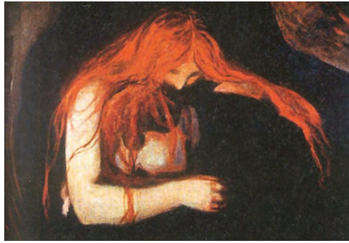
Vampire, peinture d'Edvard Munch

Yellow Birds (Stock) de Kevin Powers pourrait bien être le premier chef-d'œuvre à prendre la guerre d'Irak pour sujet. C'est du moins l'impression qui se dégage à la lecture des comptes rendus qu'en a fait la presse littéraire française. « Un sublime premier roman en forme d'oraison à ceux qui rentrent du front », écrit Le Monde .