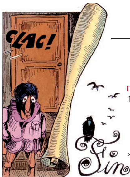
Fred, L'histoire du corbac aux baskets , Dargaud