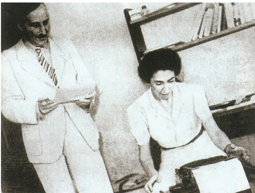
Stefan Zweig avec Lotte : épouse et collaboratrice