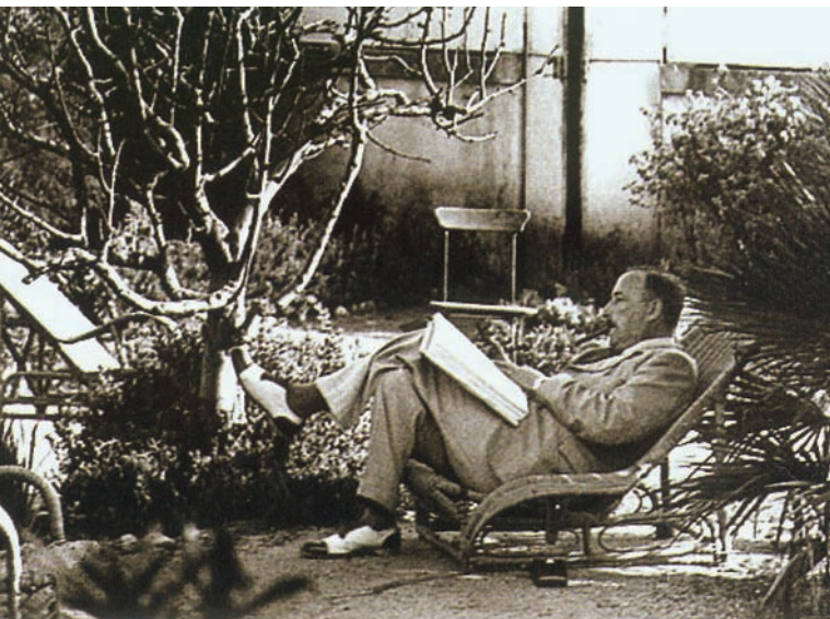
Stefan Zweig au Brésil