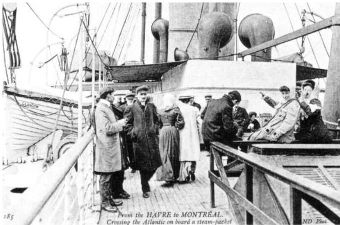
Traversée Le Havre-Montréal, p. 10

transport des résidents du lieu. Quant à la langue d'affichage dans les villes... la « loi 101 » viendra beaucoup plus tard.