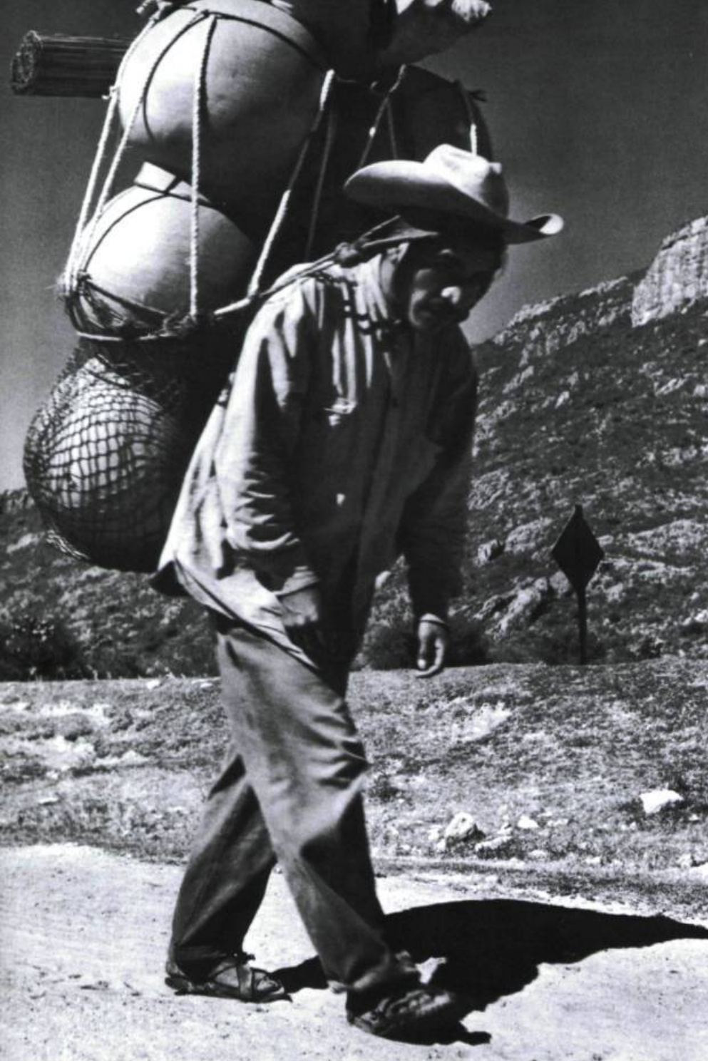
Paysan sur la route au Mexique.

d'action humaine et de la possibilité d'agir sur l'univers. Ainsi, dans l'histoire universelle, l'Amérique deviendrait « le pays de l'avenir et de la liberté ». Comment s'y prend l'auteur pour en arriver à ce constat ?