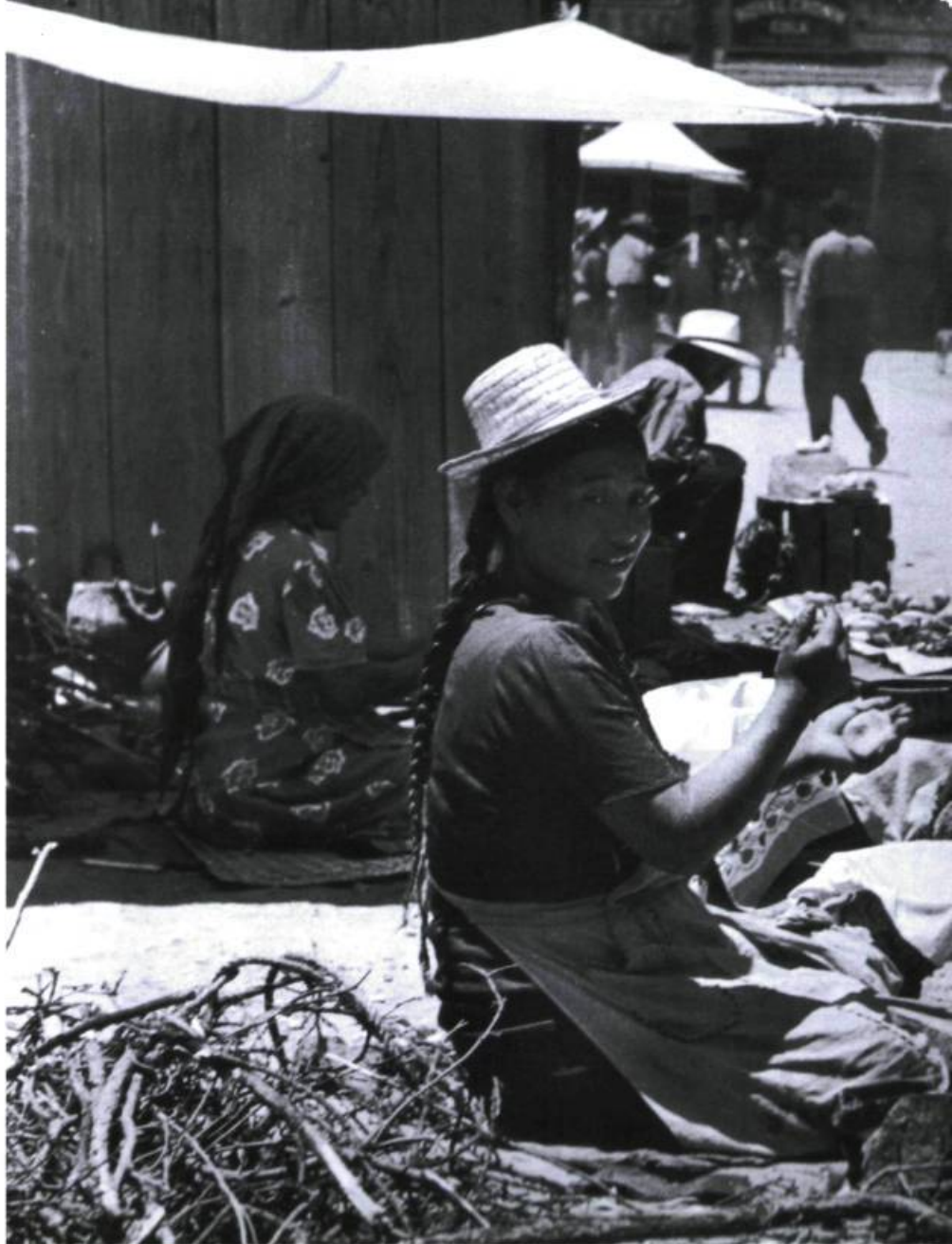
Un marché en plein air au Mexique, photo de Gisèle Freund.

Néstor García Canclini, L'Amérique latine au XXI e siècle , p. 2.