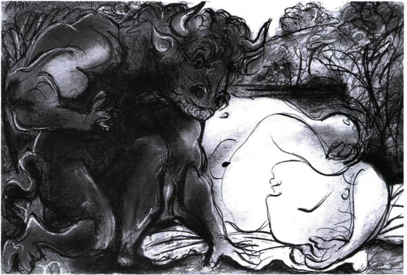
Pablo Picasso : Le Minotaure , 12 novembre 1933. Gouache, pastel crayons de couleur, plume et encre de Chine sur papier ; 34 x 51,4. Dijon, musée des Beaux-arts, inv. D G44 [P]