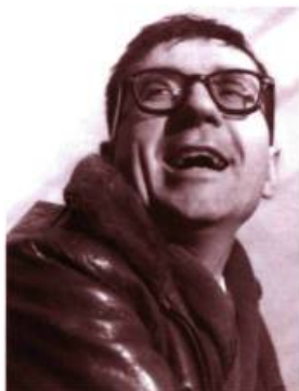
Gaston Miron en 1957