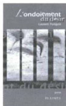
L'ondoisement du désir Laurent Poliquin

L'ondoisement du désir poursuit le travail d'assainissement du réel par « l'ébruitement des baisers ». L'auteur de Volute velour nous invite à une poésie de la convoitise, qui cherche à nouer l'harmonie de la lascivité et du mécontentement.