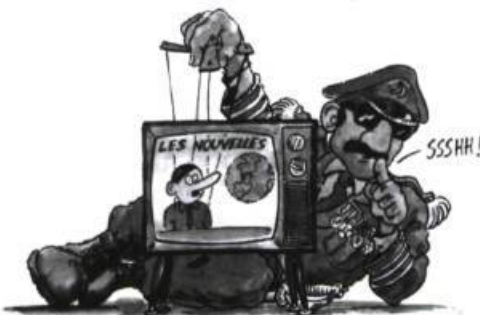
La démocratie, j'aime ça !