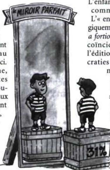
La démocratie, je la reconnais !

gros avantage qu'offrent ces albums, c'est justement qu'ils ont été réalisés au Québec ; ils sont ainsi adaptés au jeune lectorat d'ici. Si l'on cherche, dans les récentes parutions, des ouvrages destinés aux jeunes qui traitent de démocratie, on trouvera par exemple une trilogie fort bien faite, parue au Seuil, à la maquette