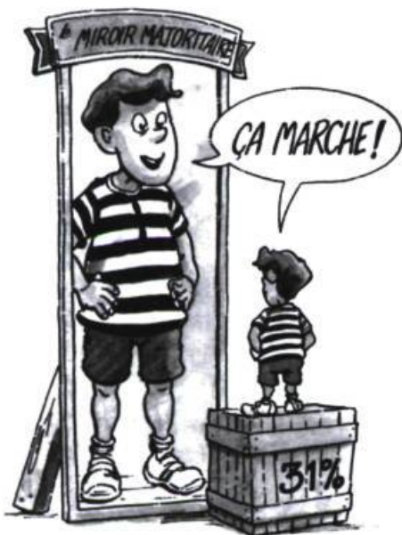
La démocratie, je la reconnais !

Dans La démocratie, je l'invente ! , il propose ainsi à ses jeunes lecteurs de faire partie du Grand Club Démocratique où ils auront les mêmes droits et la même liberté que tous les autres membres, à ceci près qu'ils auront également un devoir : celui de solidarité. Quel symbole plus marquant, pour la figurer, qu'une cordée d'alpinistes, « la fraternité à son plus beau 5 » ? Pourquoi ne pas s'inspirer du règne animal, aussi, de ce que Laurent Laplante nomme joliment « le grand