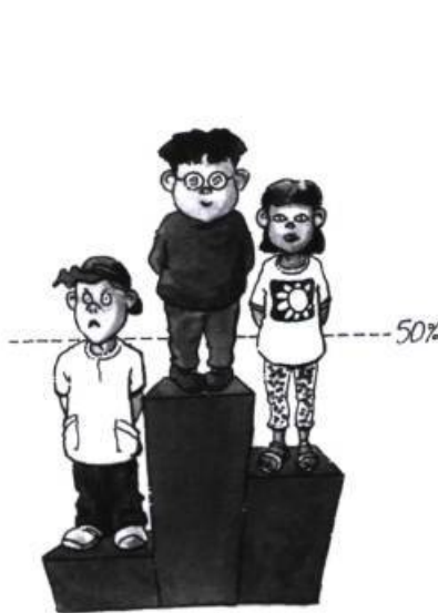
Pourcentage des votes...