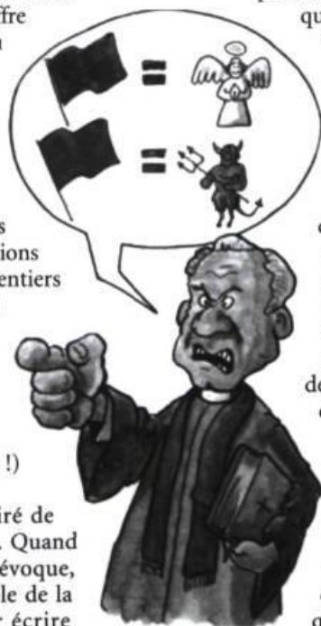
La démocratie, je l'apprends !