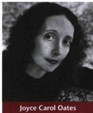
Joyce Carol Oates