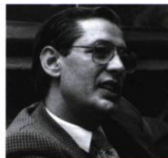
Michel del Castillo