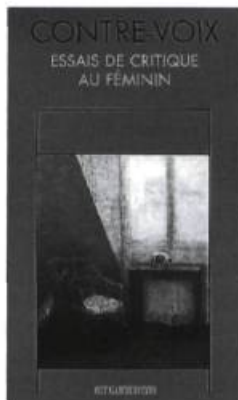
CONTRE-VOIX Essais de critique au féminin Lori Saint-Martin 295 pages 24 $