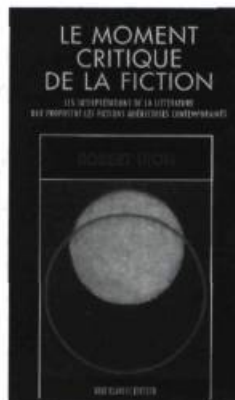
LE MOMENT CRITIQUE DE LA FICTION Robert Dion 208 pages 22 $