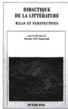
DIDACTIQUE DE LA LITTÉRATURE Bilan et perspectives Sous la direction de Monique Noël-Gaudreault 257 pages 24 $