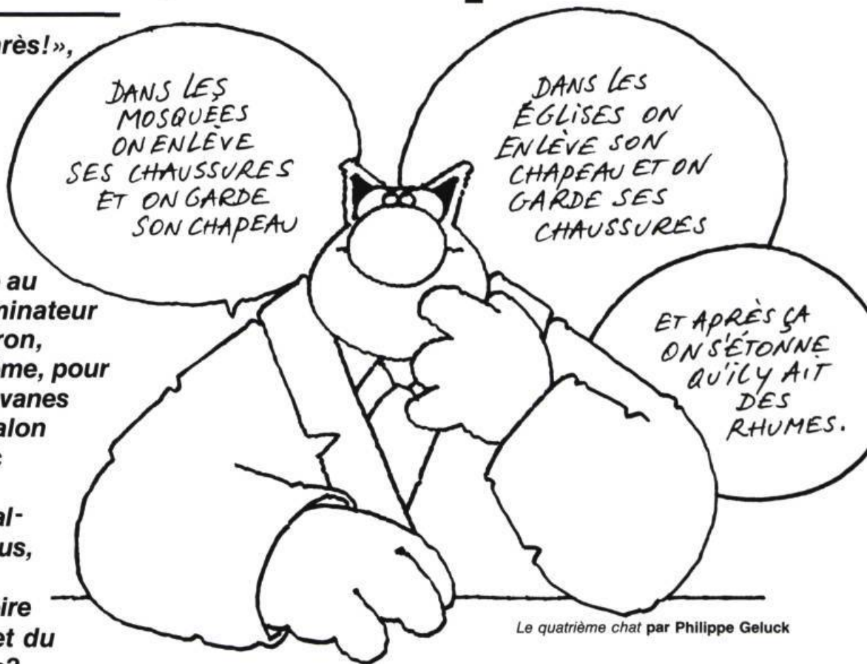
Le quatrième chat par Philippe Geluck