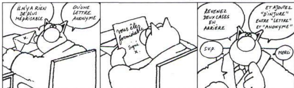
Le quatrième chat par Philippe Geluck

Pour votre gouverne, pourquoi ne pas vous offrir la lecture rétrospective du cahier spécial de Libération du