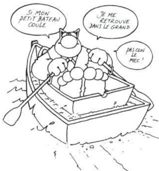
Le quatrième chat par Philippe Geluck