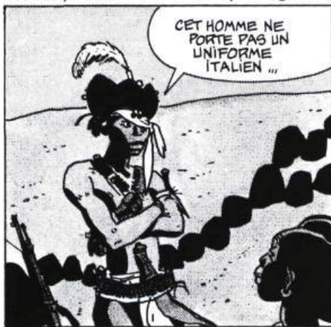
Les scorpions du désert tome 2 par Hugo Pratt

Hilarant! On n'en demanderait pas plus. Nette parenté avec La jungle en folie et Le Concombre précédemment cité. Hybride quoi! Un saurien en devenir s'en tire au mieux dans un monde qui n'a pas opté pour une définitive routine. L'œuf et la poule concoctent leur paradoxe et les saisons ne se sont pas encore partagé équitablement l'année. Couleurs criardes: évidemment! C'est de la littérature jeunesse!