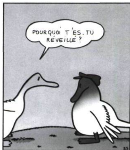
Théocrite tome 1, Le bonheur au bout du fil par Jean-Luc et Philippe Coudray