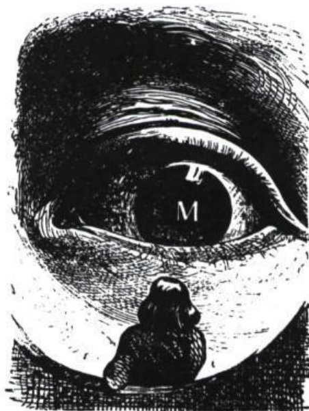
Voyages de Gulliver par J.J. Grandville