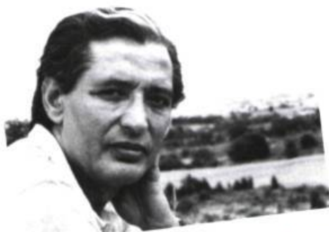
Michel del Castillo