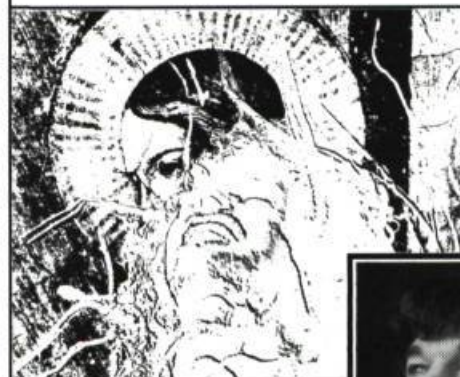
Photocollage: AREL JONES

Un soir, Bob fait la connaissance d'un groupe d'amies au Lux , ce restaurant à la mode de Montréal. En congé de maladie à cause d'un problème de surdité, il aura l'occasion de les revoir à plusieurs reprises. Mais pourra-t-il passer à travers l'épreuve des discours que ces filles pratiquent? Elles ont tout lu, tout vu, ont réponse à tout et cherchent à l'initier à leur science infuse, pour lui confuser... Au bout du compte, réussira-t-il à sauver sa peau de chagrin?