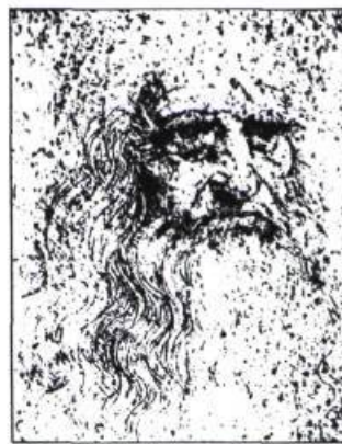
Léonard de Vinci

On retrouvait beaucoup ce genre d'affirmation chez les porte-parole des mouvements radicaux des années 1970. Un discours qui redevient actuel puisque, à la suite des situationnistes Raoul Vaneigem et Guy Debord, il est repris par André Gortz dans Métamorphoses du travail, quête du sens chez Galilée. ●