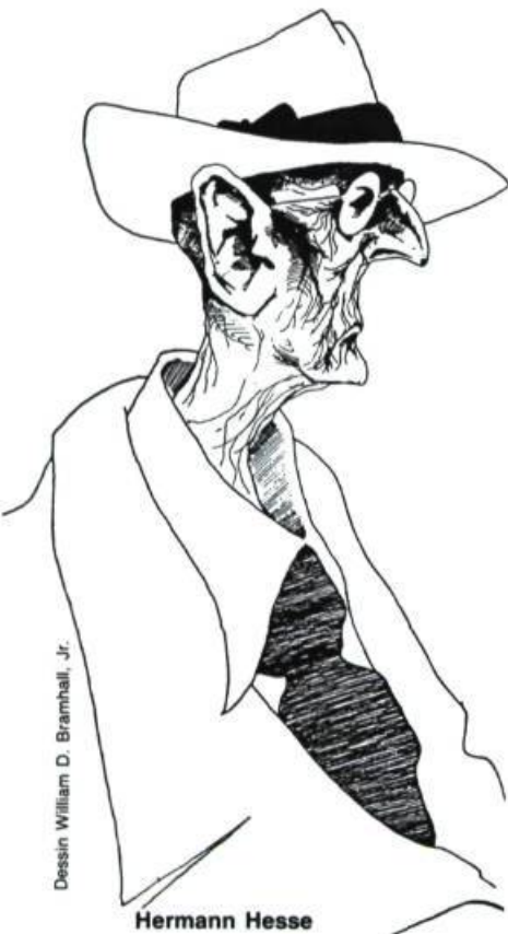
Dessin William D. Bramhall, Jr.

Je ne sais plus si les jeunes représentent l'avenir. Je ne sais pas non plus si les livres peuvent changer le monde. Mais je sais que j'ai droit à ma naïveté. C'est tellement cute , n'est-ce pas, écrire pour les enfants...» ●