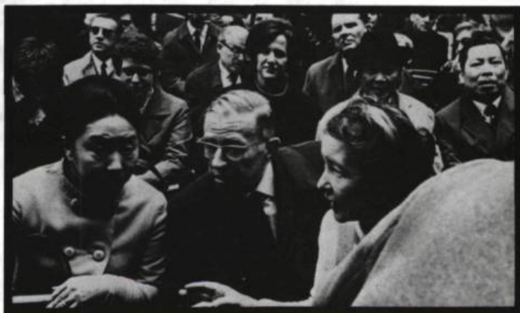
Sartre, Beauvoir et leur amie japonaise Tomiko Asabuki participaient à la journée des intellectuels pour le Vietnam le 23 mars 1968.

sonnages de fiction relative; toute-puissance précaire du biographe qui, un instant seulement et illusoirement, se quitte sans deuil aucun, cherchant une possible Vérité.