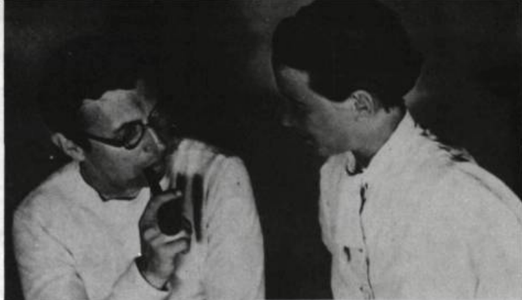
Sartre et Simone de Beauvoir en villégiature à Juan-les-Pins peu avant la guerre.

De quoi? De soi, fort probablement. N'est-ce pas une chance inespérée, pour le biographe, d'ainsi dévier le corps à corps? L'hydre, ça n'est plus la mouvance de son imaginaire et de ses attermolements existentiels, mais l'opacité de l'Autre, concret, réel. Bonheur du biographe que de vaincre le monstre à grand renfort de documents et de témoignages; bonheur que de raconter la multiplicité du héros; bonheur ultime que de trouver un pont protecteur entre la nudité du moi et la cruauté du monde. Et si «la réalité dépasse la fiction», dit Cohen-Solal de Sartre, ça n'est jamais que celle d'un autre. Vulnérabilité de l'écrivain, qui morcelle son moi dans des per-