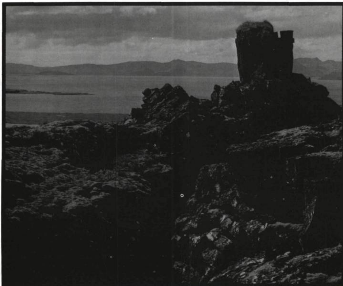
Adossé à ces rochers de Thingvellir, l'orateur pouvait aisément se faire entendre des membres de l'Althing.

Pour les anciens Nordiques, assumer son destin signifiait que, sous aucun prétexte, ils ne pouvaient tolérer qu'on empêche celui-ci de se réaliser. Dans de telles conditions, rarissimes seront les héros de sagas qui ne se vengeront pas lorsqu'ils se considéreront victimes d'un affront. Peu importe si elle doit s'exercer sur des personnes qu'on aime ou que l'occasion de la pratiquer ne se présente que plusieurs années après que l'offense ait été subie, la vengeance sera un droit, un droit inaliénable.