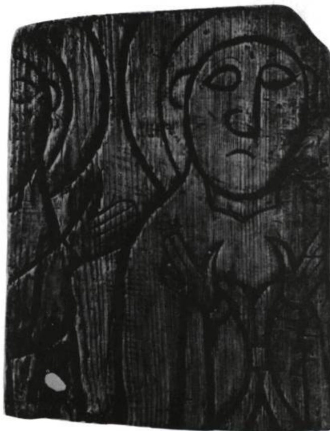
Panneau mural islandais du XI e siècle représentant un saint en prière.