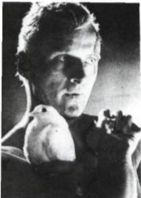
Blade runner, 1982