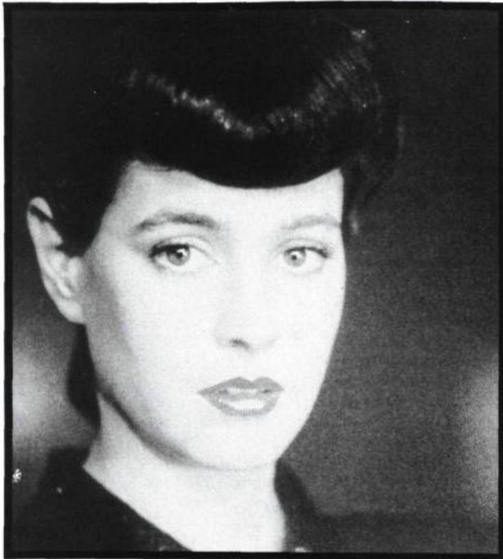
Blade runner, 1982

(qui, c'est justice, massacre le mouton naturel acheté avec l'argent-du-sang...) et après avoir eu une sorte d'expérience mystique assez obscure où la solidarité entre toutes les formes de vie semble lui être apparue.