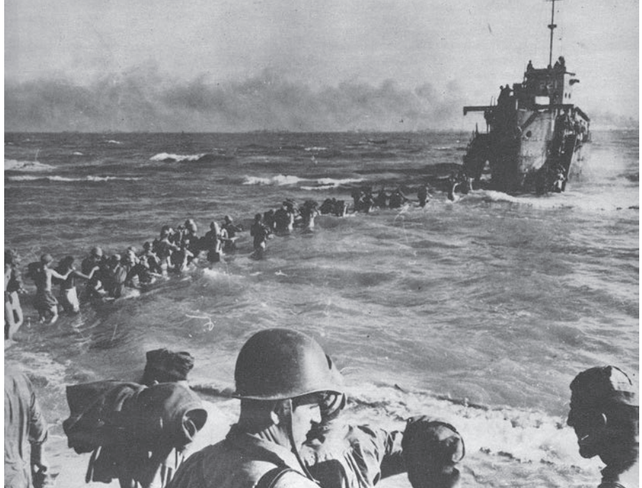
Débarquement en Sicile.