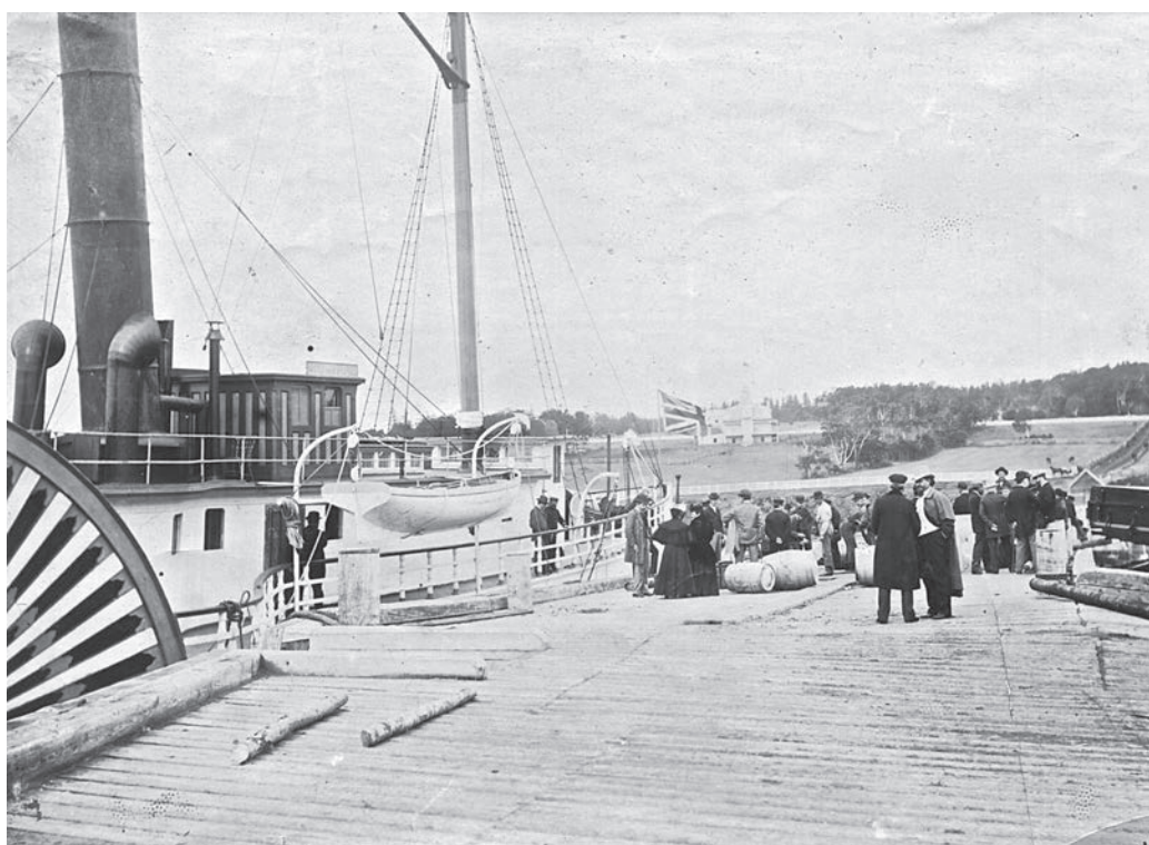
Le vapeur Admiral au quai de New Carlisle, vers 1900-1910.

Les « excursionnistes » se réunissent à Lévis où, le vendredi matin, ils prennent le train Intercolonial dans un wagon que leur a réservé la compagnie qui les mène à Campbellton où ils changent de train pour atteindre Dalhousie à 21 h. En soi, tout un périple qui se répètera dans l'autre sens. Les journalistes insistent beaucoup sur le temps que ça prend pour joindre Dalhousie, dénonçant l'absence de train et de route le