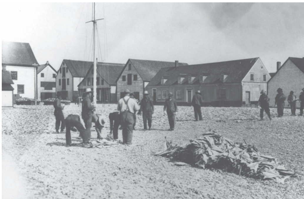
Le site de pêche de Paspébiac où on y fait le séchage de la morue attire beaucoup l'attention des journalistes.

Les journalistes font l'éloge de la région, cherchant manifestement à susciter un engouement chez leurs lecteurs à l'image de L'Électeur : « Nous passons