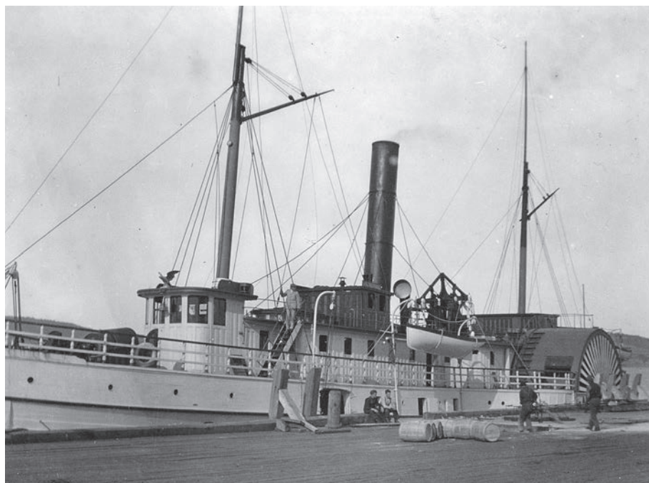
Le vapeur Admiral vers 1900.

Si le docteur Dionne fait fi des paysages et des réceptions dans ses textes, ses confrères les décrivent en insistant davantage sur les réceptions