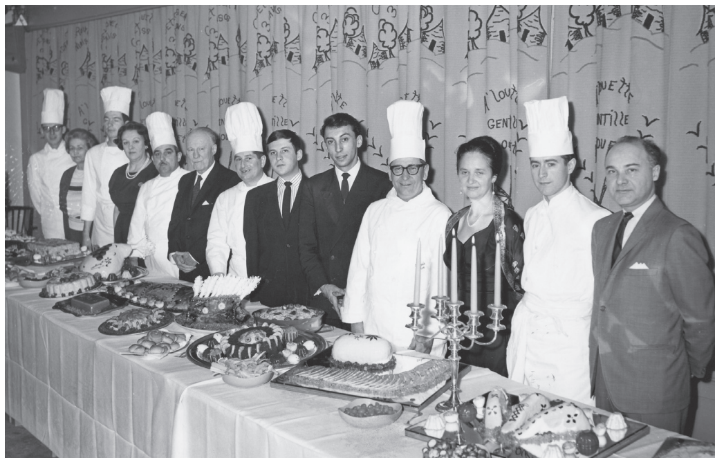
Les cuisiniers du Québec sont réunis à l'hôtel St-Louis de Rivière-du-Loup.

Braiser les tranches, ajouter eau, oignon, vin blanc, poudre carvi et deux tasses de bière, braiser à feu moyen, porc ou bœuf, ajouter le reste des produits, mijoter à feu bas, juste bien cuit, épaissir légèrement, assaisonner, sel poivre, servir sur riz ou pomme de terre en purée.