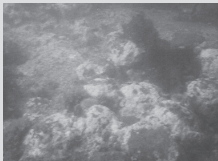
Amoncellement de boulets de canon sur le site de l'épave de l' Antigua .

Les amis et partenaires en plongée sous-marine Alain Therrien et Serge Boucher de Tourelle ont visité le site et pour immortaliser ce triste centenaire, ils ont procédé, à l'été 2011, à l'installation d'une plaque commémorative de l'événement sur le treuil de l'épave 4 .