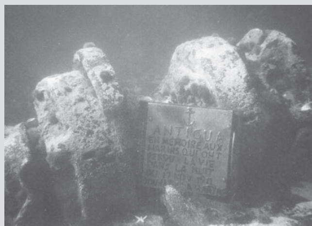
Plaque commémorative sur le site de l' Antigua .