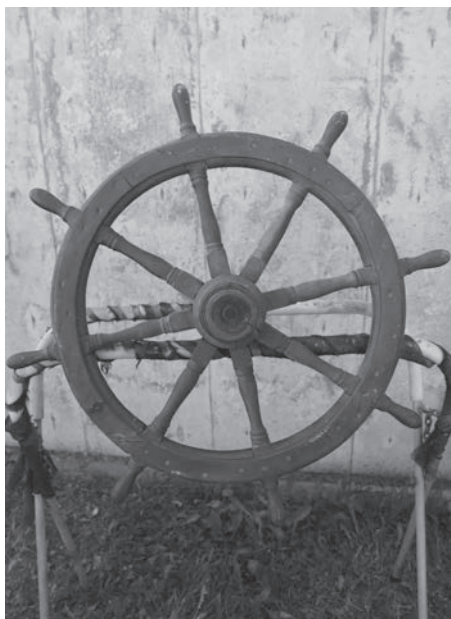
Roue du Penelope .