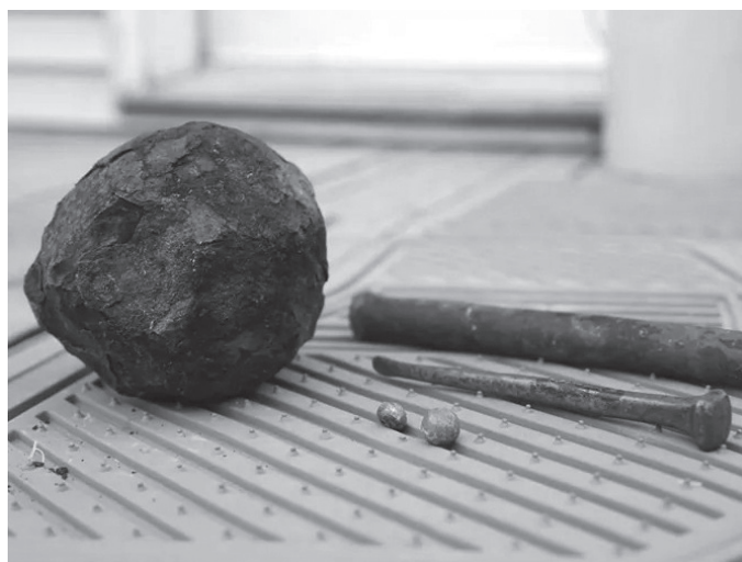
Boulet, clou et plombs de fusil provenant du Penelope .