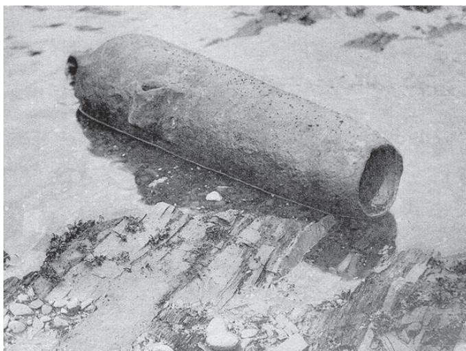
Vieux canon du Penelope sur la rive de l'Anse-aux Canons.