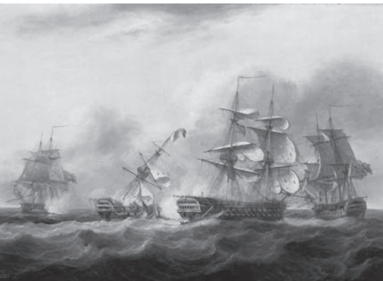
« The capture of the Guillaume Tell , 30 March 1800 ». La frégate britannique Penelope est située à gauche de ce tableau représentant une bataille navale durant les guerres révolutionnaires en Europe.

Source : Thomas Luny. Royal Museum Greenwich.