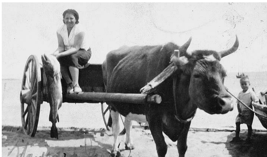
La Bolduc tenant une morue dans ses mains... définitivement, une vraie gaspésienne pure laine!