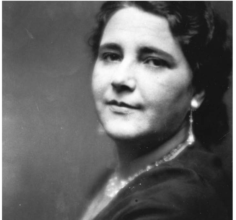
Mary Travers, dite La Bolduc.