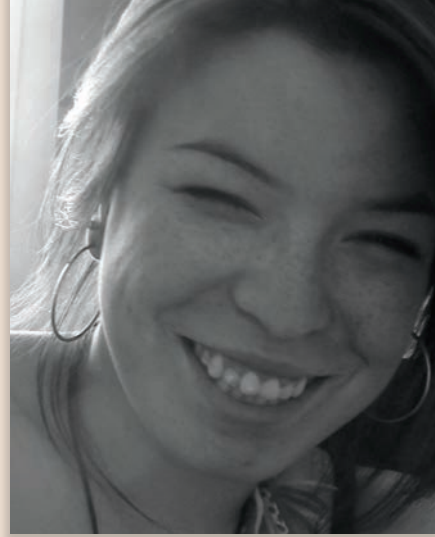
NATASHA KANAPÉ FONTAINE