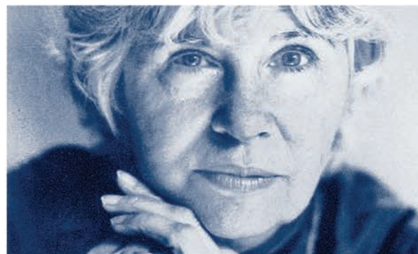
Anne Hébert

Les œuvres complètes d'Anne Hébert en édition critique sont réunies en cinq tomes, à paraître en 2013 et 2014, dans la prestigieuse collection « Bibliothèque du Nouveau Monde »