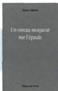
Martin Thibault Un oiseau moqueur sur l'épaule