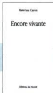
Katerine Caron Encore vivante