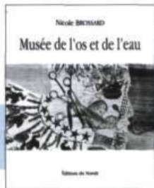
Nicole Brossard Musée de l'os et de l'eau (nouvelle édition)