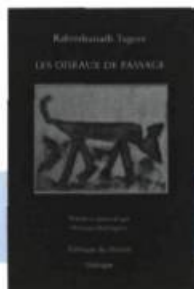
Rabindranath Tagore Les oiseaux de passage Traduit par Normand Baillargeon