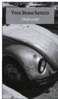
Yves Beauchemin L'enfirouapé

Maurice subissait la lente métamorphose qui fait d'un malheureux incapable de comprendre son sort un autodidacte révolté. Sa lucidité se transformait en frustration et celle-ci servait d'aiguillon à sa curiosité intellectuelle, par un