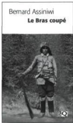
Bernard Assiniwi Le Bras coupé

BERNARD ASSINIWI Le bras coupé Montréal, BQ, 2008, 176 p., 9,95 $.