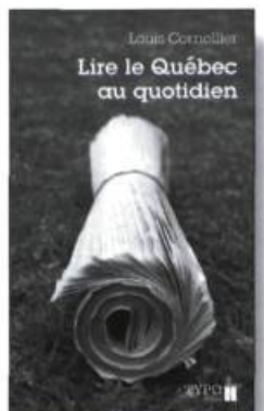
Louis Cornélius Lire le Québec au quotidien

Un travailleur qui a tout laissé tomber se fait rouler par un député véreux. En prison durant trois ans, il réfléchit ; à sa sortie, il entreprend de se venger. Il devient, à sa façon, activiste. Ce roman, conçu avant que n'éclate la crise d'Octobre 1970 et publié pour la première fois en 1974, ajoute à la politique une dimension qui ne s'y trouve pas souvent : l'humour. L'enfirouapé rassemble une galerie de personnages qui pourraient faire sourire ceux de Rabelais.