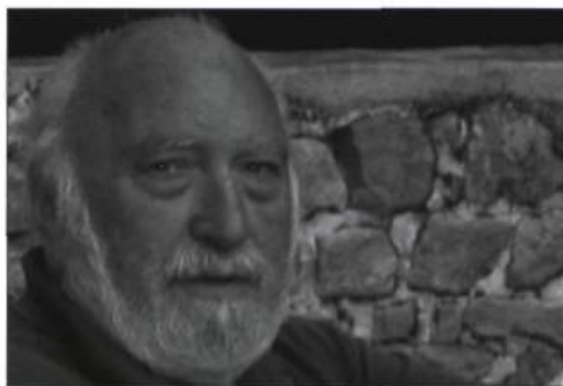
FRÉDÉRIC JACQUES TEMPLE

Que ce soit « En marchant vers le mont Tremblant », « Sur l'île d'Orléans », à « Kanawake », à « Val-David », « En forêt vers le nord » ou « Au bord du grand fleuve », les images d'Épinal ajoutent leurs touches mélancoliques et bucoliques aux sentiments exacerbés de la liberté offerte par les grands espaces et l'illusion d'une liberté montagnaise et blanche. On essaie avec le poète d'éviter « le plat village d'ennui » (« Kanawake », p. 17) qui, çà et là, guette. Mais miracle ! « Voici que les vains arpents de neige, / sous le soleil réfléchi dans mille miroirs, / rejoignent