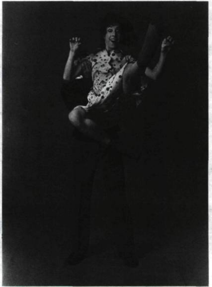
Une scène de La grandeur du geste et des passions .