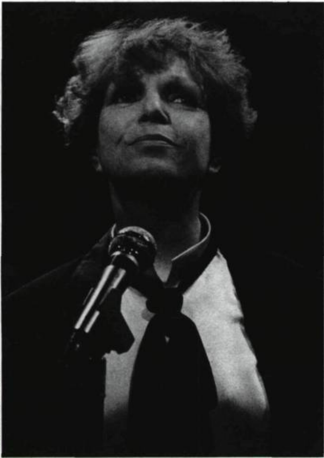
Monique Leyrac interprétant Nelligan.