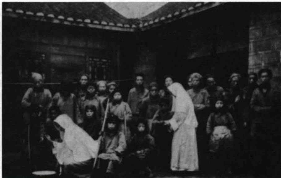
Les malheureux de l'Hôpital St-Joseph.

(Les caractères romains correspondent à des italiques dans l'original).