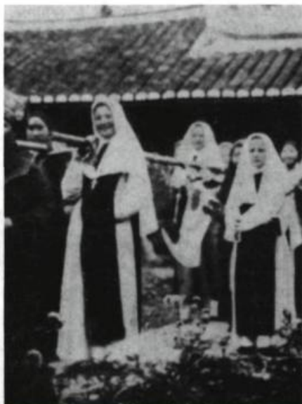
Les religieuses de Notre-Dame-des-Anges avec les vierges chinoises.