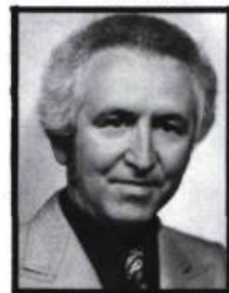
par Robert Vigneault