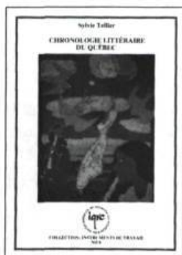
Chronologie littéraire du Québec Sylvie Tellier. 350 pages 18,50 $