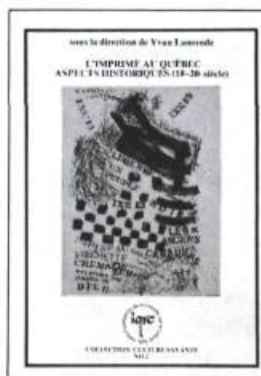
L'imprimé au Québec — Aspects historiques (18 e — 20 e siècles) sous la direction de Yvan Lamonde. 371 pages 18,00 $