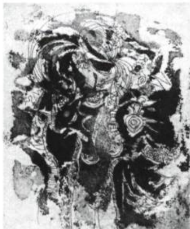
eau forte de Bellefleur

Pour plus de renseignements, on peut s'adresser aux Éditions Erta, C.P. 39, station G. Montréal.