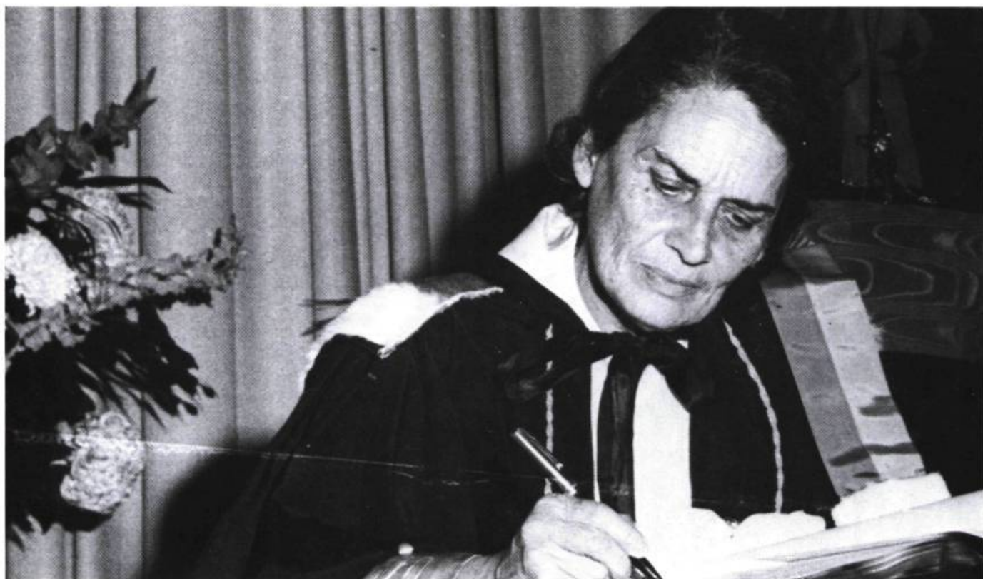
Gabrielle Roy après avoir reçu un doctorat à Laval il y a quelques années.

La jeune institutrice n'a qu'un pas à faire pour retourner sur le seuil de l'adolescence où se trouve Médéric. Qu'ensemble ils réussissent à s'éloigner un moment des murs de cette école du réel, de ce village où veille la bonne conscience soupçonneuse, et le rêve initiatique et libérant, comme jadis celui du Grand Meaulnes , pourra prendre forme. Mais il fallait que « l'école » existe, que l'un après l'autre, Vincent, Clair, Nil, Demetrioïff et André permettent à la jeune institutrice de se préparer pour le jour où le rêve passionné, piaffant et caracolant, surgirait de l'horizon. De chacun de ces petits, la narratrice n'a retenu qu'un aspect. Vincent était violent dans ses colères et dans son amour :