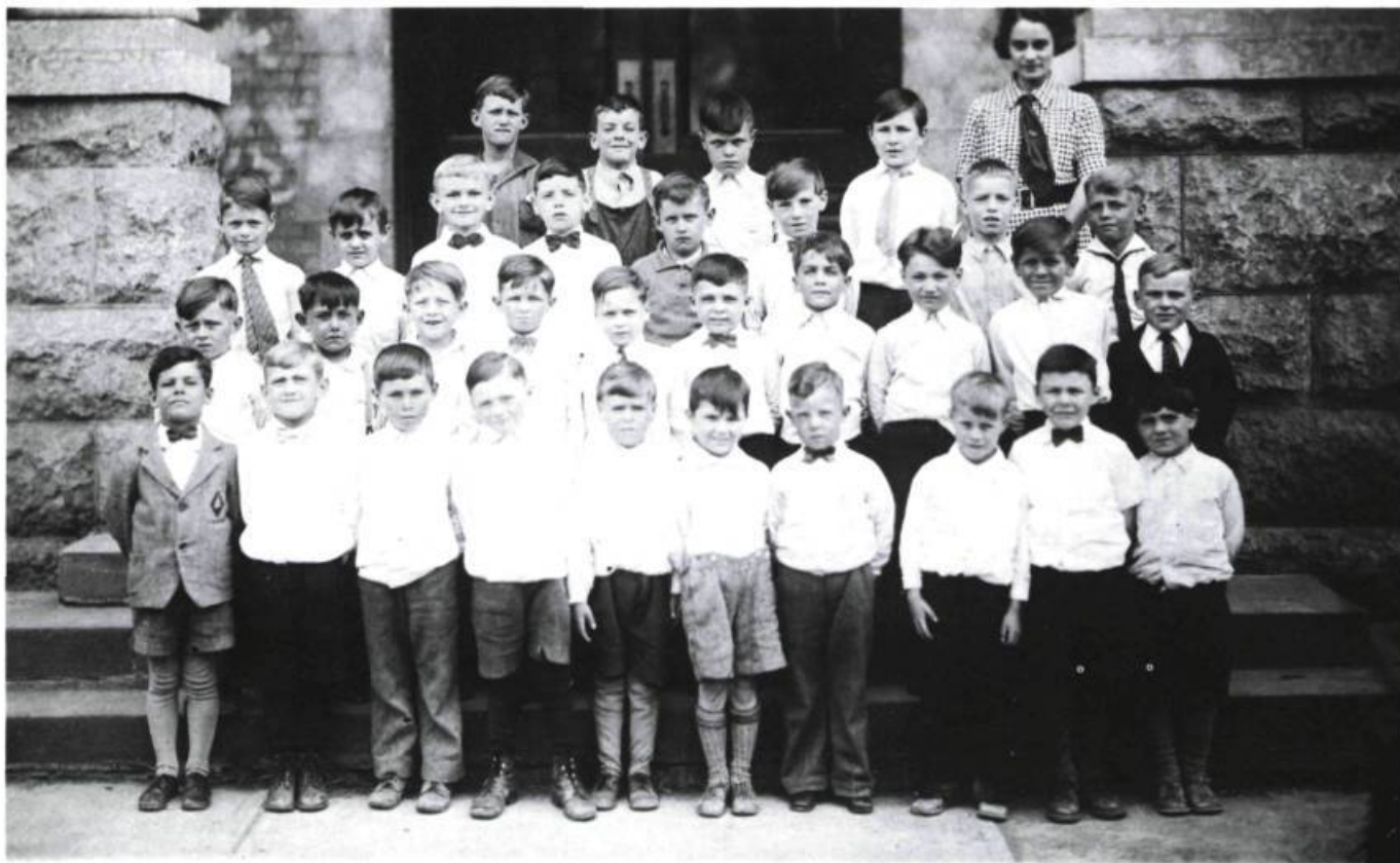
En haut, Gabrielle Roy avec sa classe à la Petite poule d'eau . En bas, à gauche, à 22 ans, à l'Académie Provencher et à droite, à Prats-de-Mollo en 1939, à la frontière franco-catalane, avec des petits réfugiés catalans.