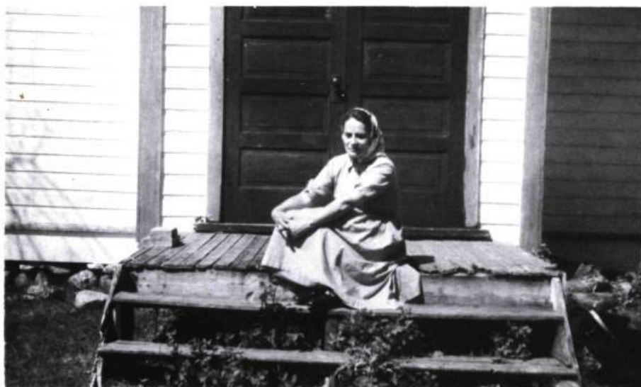
L'auteur sur le perron de la chapelle de la Petite poule d'eau, 1955.