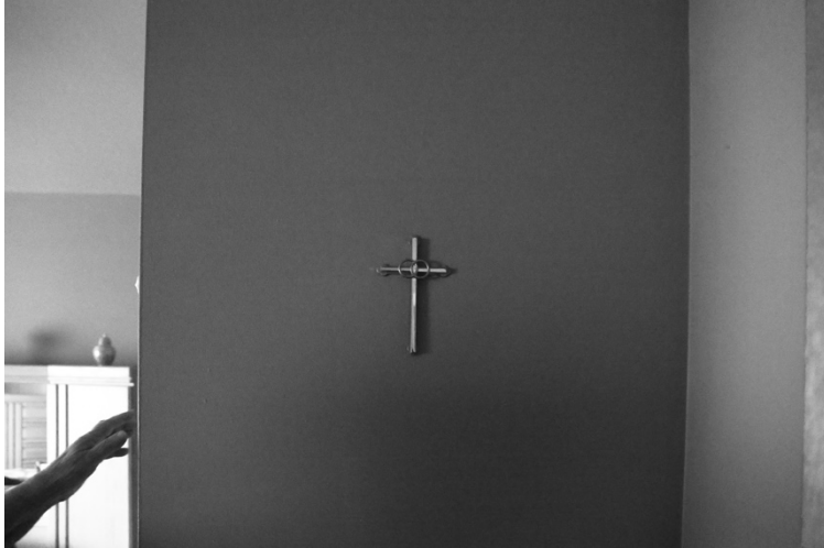
Photo 4. Une croix accrochée au mur de la chambre à coucher.