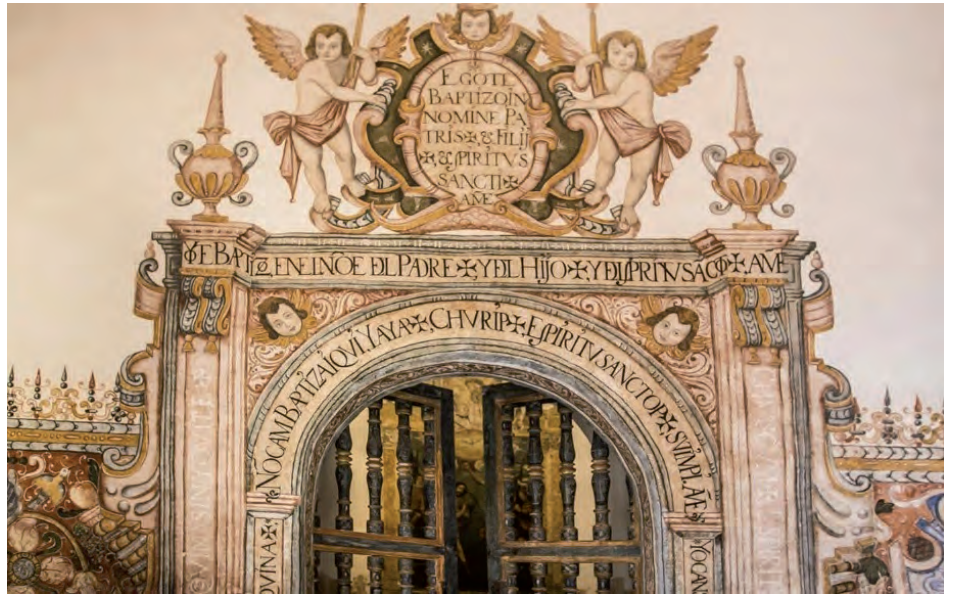
Une peinture en trompe-l'œil encadre une porte de l'église San Pedro Apóstol de Andahuayllillas, au Pérou. Cette technique est répandue dans les décors peints des intérieurs religieux andins.

Si des décors peints existaient dans des sites précolombiens, leur production s'est affirmée majestueusement avec la colonisation, épousant avec finesse les préceptes du style mauresque importé d'Espagne. Essoufflé en Europe dès le XVI e siècle, cet art restera omniprésent en Amérique du Sud jusqu'au XIX e siècle.