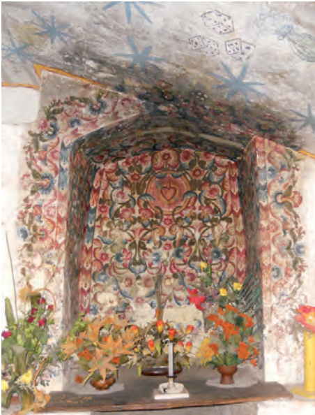
La niche du couvent de Santa Catalina à Arequipa, au Pérou, est ornée de décorations évoquant la flore andine.