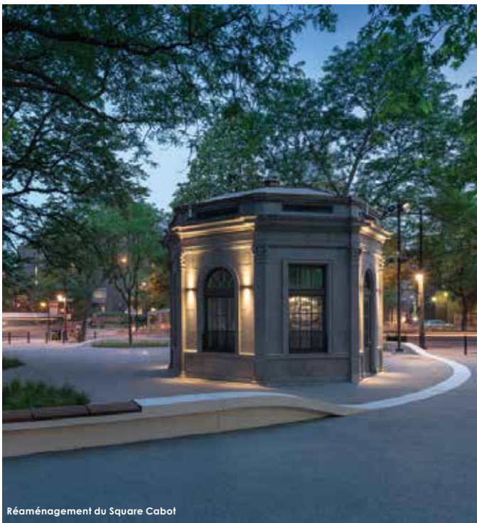
Réaménagement du Square Cabot