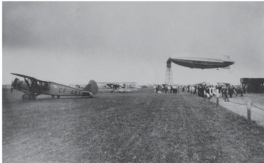
↑ Le dirigeable R-100 à l'aéroport de Saint-Hubert en 1930