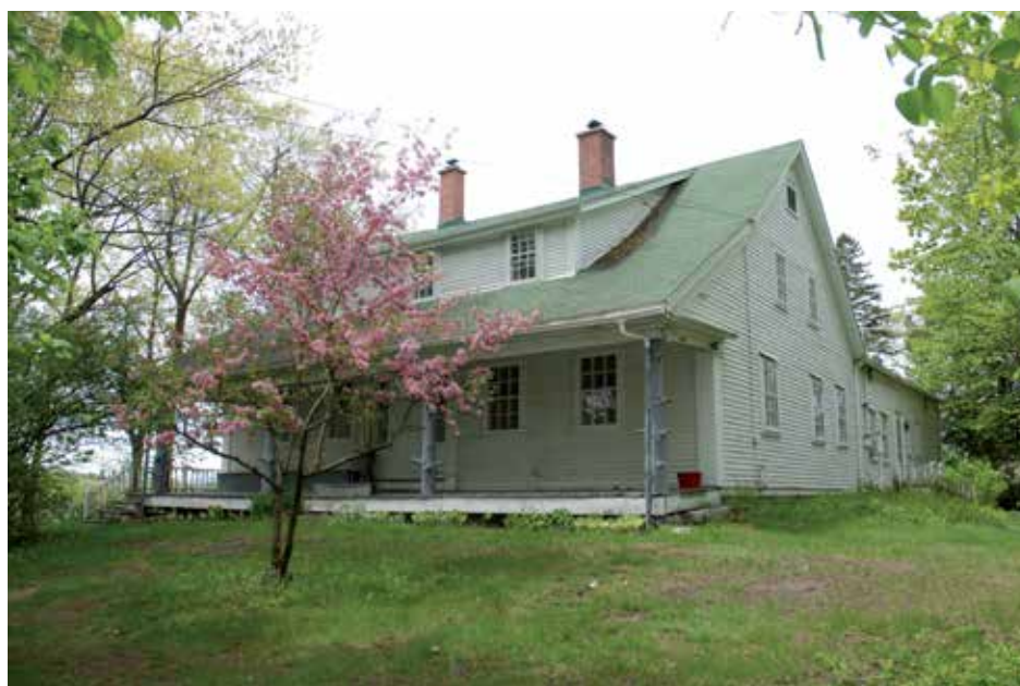
Résidence de Ralph Merry en 1881, 60 ans après sa construction (en haut), et en 2013, 5 ans après son acquisition par la Ville de Magog

Source de l'illustration : Musée McCord, M987.253.18 Photo : Chantal Lefebvre