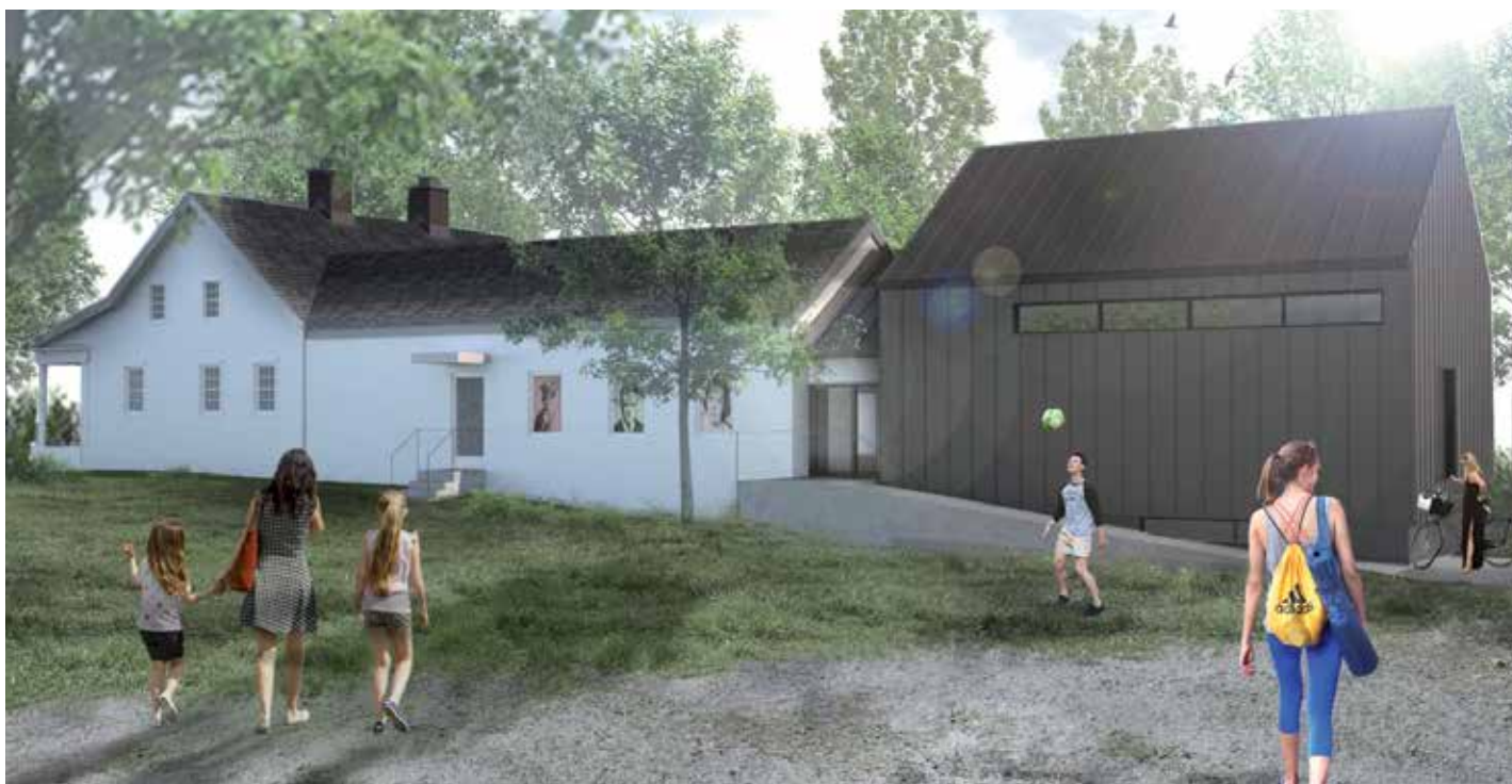
Esquisse du lieu de mémoire citoyen qui accueillera les visiteurs dès cet été

En ouvrant ses portes, la maison Merry espère contribuer à la qualité de vie des citoyens, mais aussi à la revitalisation du centre-ville, au développement urbain et à la diversification de l'offre touristique.