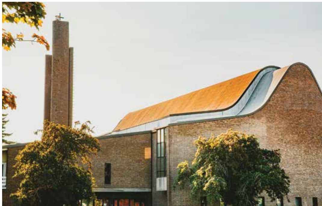
Vue de l'église en août dernier

cipaux ou gouvernementaux ne sont pas suffisants ?