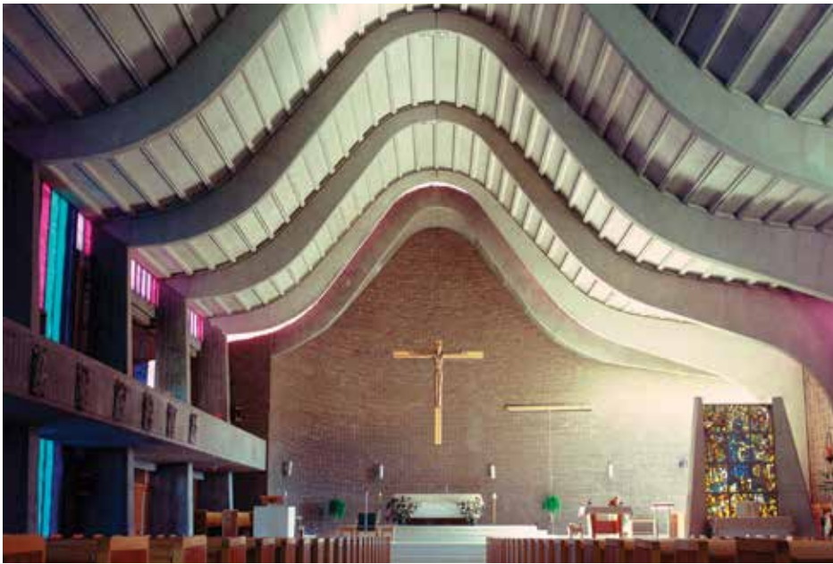
Intérieur de l'église de Saint-Gérard-Majella en 1979