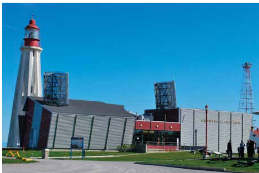
↑ Au Site historique maritime de la Pointe-au-Père, le Musée Empress of Ireland raconte l'histoire de ce paquebot et de la plus grande tragédie maritime du Canada.

Sa situation au cœur du village a valu au phare de La Martre (1906) le surnom de « Cadillac des phares ». Les quatre gardiens qui s'y sont succédé n'ont pas eu à endurer l'isolement qu'impose généralement leur métier. Le bâtiment de structure octogonale se démarque par son ossature en bois, unique sur la côte gaspésienne. Sans compter que son horlogerie d'origine assure toujours la rotation de son module d'éclairage. Tout près, le Musée des phares présente une exposition permanente sur l'évolution des lanternes de phares de 1700 à aujourd'hui.