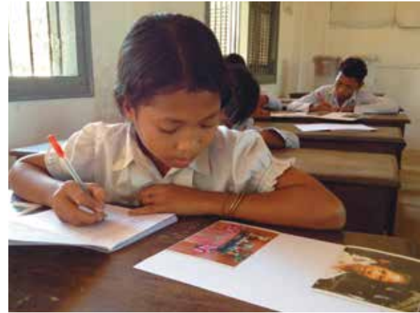
Les jeunes ont pris très au sérieux l'étape qui consistait à écrire un texte pour accompagner leur photo.

■ Blandine Clerget est coordonnatrice aux activités éducatives à Action patrimoine.