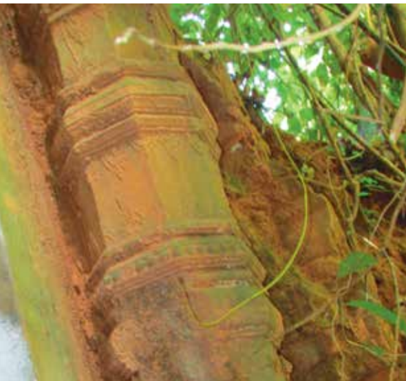
Hors des sentiers battus, un des groupes d'explorateurs a même photographié les restes d'un temple caché par la forêt.