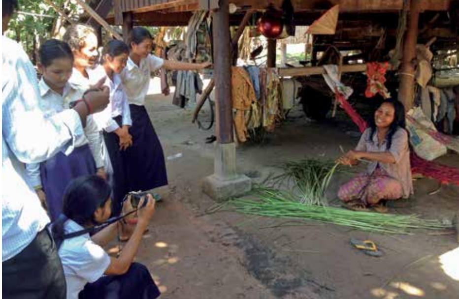
Le tressage du rumchék est essentiel à l'économie des petits villages. Ici, une vannière démontre ce savoir-faire ancestral.