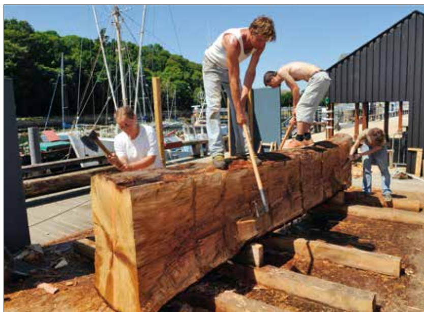
Sur le chantier naval des Ateliers de l'Enfer à Douarnenez, 11 jeunes bénévoles de divers pays ont relevé le défi de creuser à l'identique une pirogue monoxyle, sur le modèle d'une épave médiévale découverte près de Vannes en 1906.