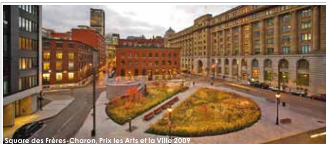
Square des Frères-Charon, Prix les Arts et la Ville 2009