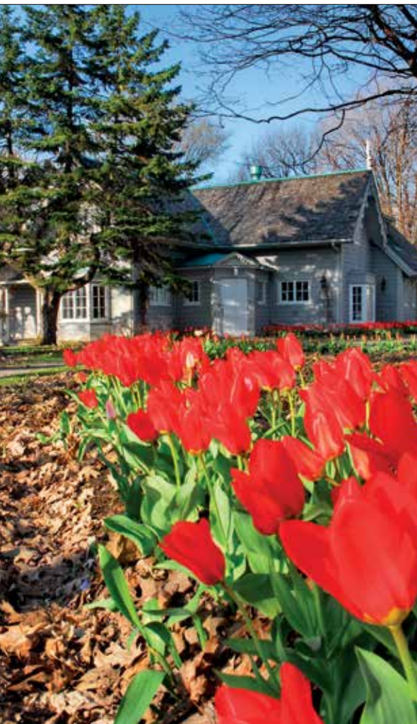
La villa pittoresque cherche à se fondre dans la nature qui l'entoure, comme en témoigne la villa Bagatelle.